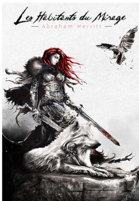
Les habitants du mirage d'Abraham Merritt aux Éditions Callidor

Les Habitants du mirage a été réédité en version illustrée par les Éditions Callidor dans la collection l'âge d'or de la fantasy en 2015. Les illustrations ont été réalisées par Sébastien Jourdain, et le livre a été édité avec la fin voulue par l'auteur qui n'était pas celle de l'édition de 1974 que j'ai lu.