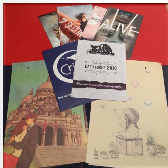
Petites choses récoltées au cours de mon périple

Enfin troisième arrêt marquant chez les Éditions l'Atalante et Critic. Deux maisons d'Éditions que je connais pour avoir déjà acheté des livres de leurs catalogues. Plusieurs auteurs dédicaçaient leurs livres, je me suis laissée tenter par un livre dont l'histoire se déroule en France et dont le 4e de couv' m'a beaucoup plu.