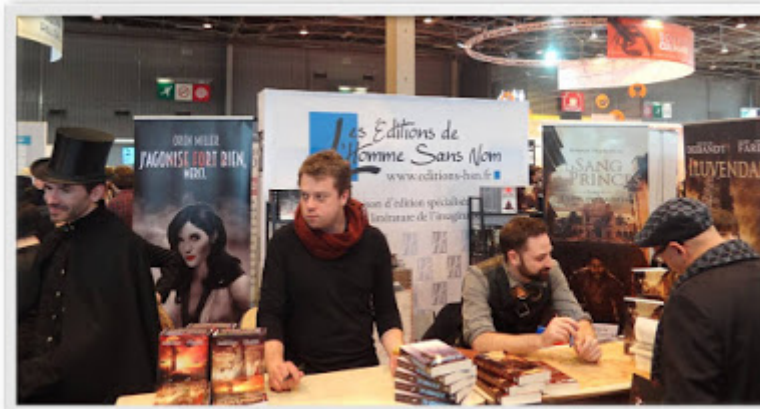
Stand des Éditions de l'homme sans nom.

Ensuite, direction les stands des plus petits Éditeurs et notamment les Éditeurs de l'imaginaire. Après un passage éclair par les Stand Kana, Soleil, Delcourt et Ki-Oon, première étape par le stand des Édition de l'homme sans nom, HSN. J'arrive sur un stand où 4 auteurs sont en train de présenter et de dédicacer leurs livres. Là l'ambiance est beaucoup plus sympa et j'ai discuté avec plusieurs auteurs, résultat je suis repartie avec 3 livres dédicacés!