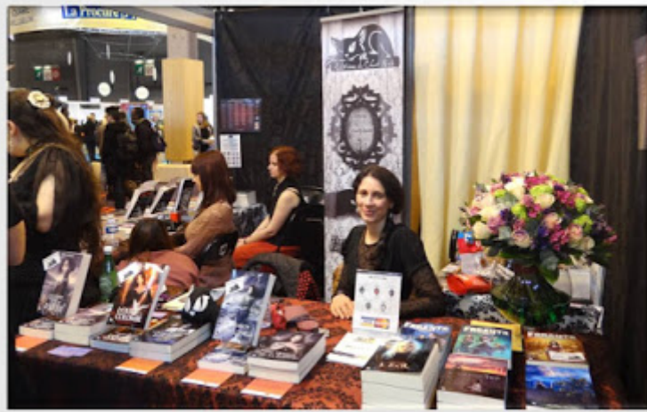
Stand des Éditions le Chat Noir

sympathique, là encore je suis repartie avec un seul livre en pensant très fort à mon porte monnaie !