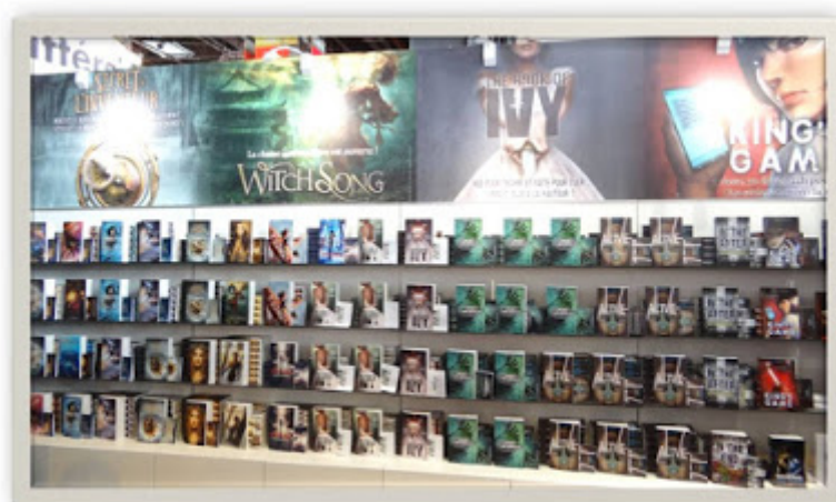
Stand des Éditions Lumen (un des plus beaux stand) au salon du livre de Paris

D'abord j'ai fait un tour au stand de la Corée du Sud, invitée d'honneur du salon du Livre (c'est l'année de la Corée du Sud en France). Le stand était superbe, on y trouvait de tout : romans, mangas, livres de cuisine, dessin, jeux, etc... je l'ai vraiment trouvé chouette. Bon pour ceux qui me connaissent vous vous doutez que je suis reparti avec un manga coréen. Il y en avait plein qui avait l'air vraiment sympa ! J'ai résisté devant les livres de cuisine ☐