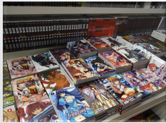
Stand de la Corée du Sud au salon du Livre de Paris

Ensuite, direction les stands des plus petits Éditeurs et notamment les Éditeurs de l'imaginaire. Après un passage éclair par les Stand Kana, Soleil, Delcourt et Ki-Oon, première étape par le stand des Édition de l'homme sans nom, HSN. J'arrive sur un stand où 4 auteurs sont en train de présenter et de dédicacer leurs livres. Là l'ambiance est beaucoup plus sympa et j'ai discuté avec plusieurs auteurs, résultat je suis repartie avec 3 livres dédicacés!