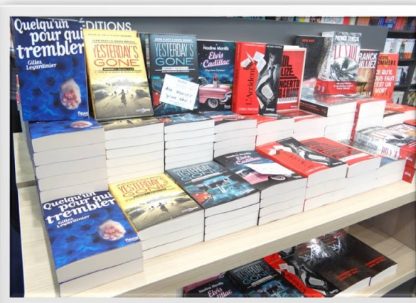
Stand des Éditions Gallimard et des Éditions Fleuve au salon du livre de Paris 2016