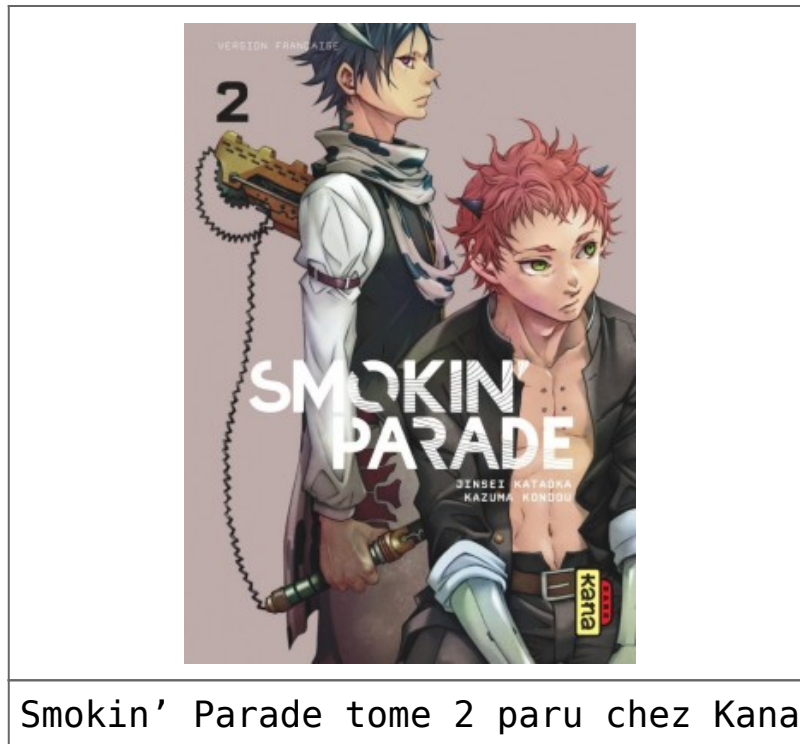
Smokin' Parade tome 2 paru chez Kana

Et voilà pour cette semaine rendez-vous la semaine prochaine !!